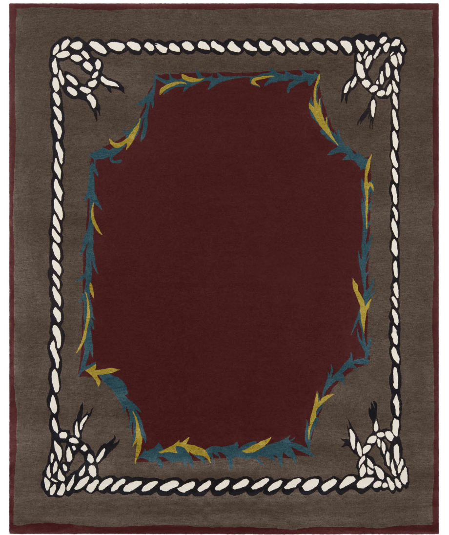
Provence Crête de coq Laine / Wool