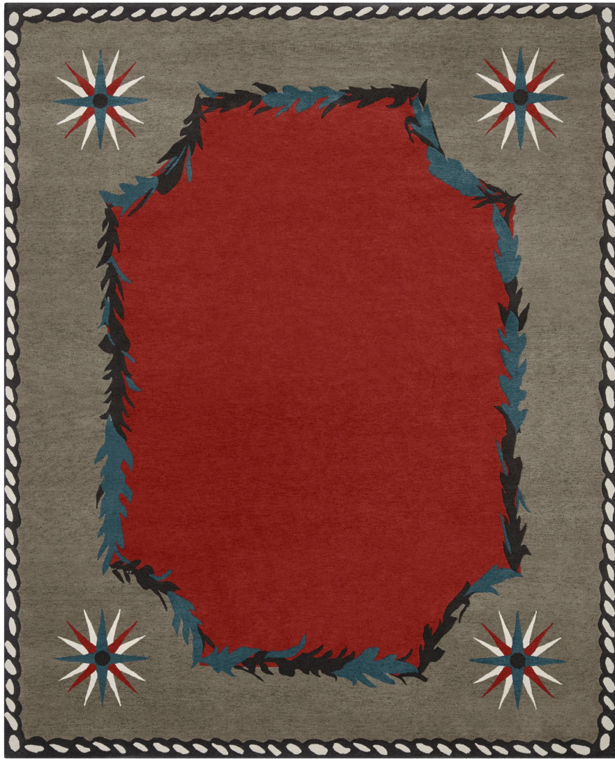
Nossi-bé Crête de coq Laine / Wool