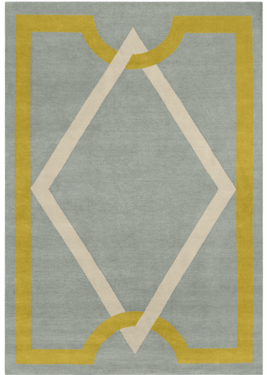
Élysée Nuit d'été Laine / Wool