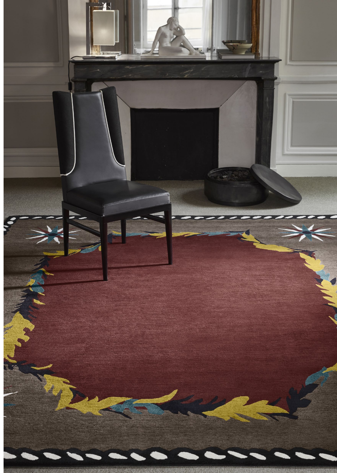
Nossi-bé Almandin Laine / Wool