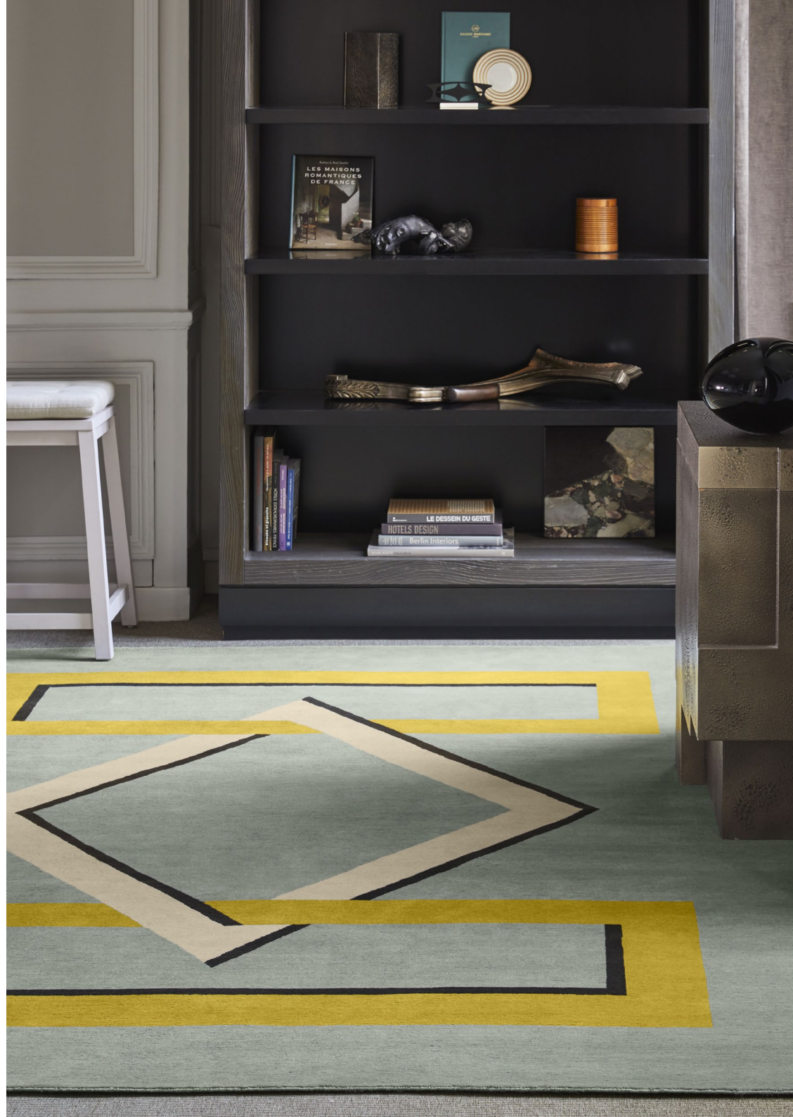
Matignon Brume Laine / Wool